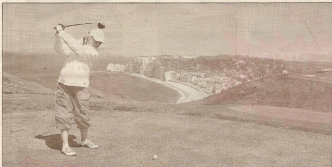
La vue magnifique depuis le parcours fait du golf d'Etretat l'un des plus beaux du monde

U n chemin qui serpente dans la forêt, une chaussée et un parking défoncé, un bâtiment d'accueil qui penche dangereusement... Il en faut du courage pour accéder aux beautés du parcours de golf d'Etretat. Mais une fois sur le green, c'est l'extase, la vue panoramique sur la mer et les falaises les plus connues au monde. Depuis des